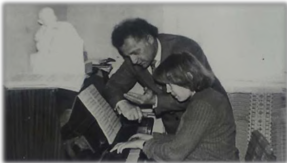
Консерватория – урок чтения партитур

Дрожит лес осиновой дрожью, Роняя последние листья, Туман по бороздам невсхожим С зарёй расстилается мгlistый. Давно журавли откричали Прощанье в небесную просинь, Оставив нам чувство печали – Задумчиво-грустную осень. (1959)